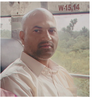
మే 16 ప్రజా దివాన్

తెలంగాణ జేపీసీ రాష్ట్ర కార్యదర్శి ప్రీడం ఫైటర్ శ్రీనివాస్ ఏమైంది