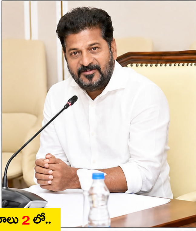
వివరాలు 2 లో..