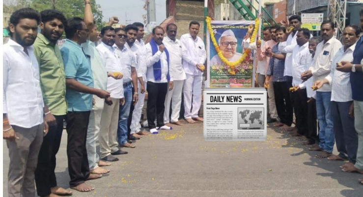
వేములవాడ/ప్రజాదివాన్ ఏప్రిల్ 05 భారత మాజీ ఉప ప్రధాని, నవభారత నిర్మాణ శిల్పి డాక్టర్ బాబు జగ్జీవన్ రామ్ 119వ జయంతి వేడుకలను వేములవాడ మున్సిపల్ కార్యాలయంలో ఆదివారం అత్యంత ఘనంగా