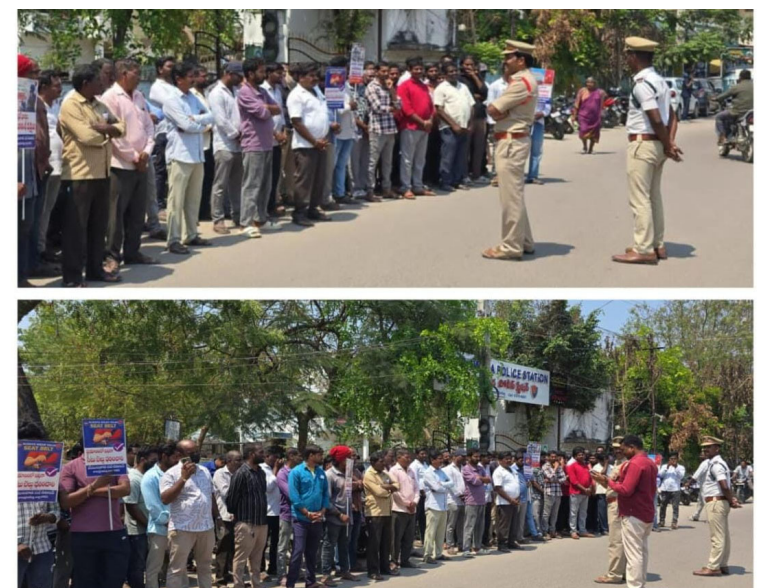
వేములవాడ/ప్రజాదివాన్ మార్చి 26 వేములవాడ పట్టణ పోలీస్ స్టేషన్ పరిధిలో జిల్లా ఎస్పీ ఆదేశాల మేరకు పట్టణ పరిధిలో డ్రంకన్ అండ్ డ్రైవ్ తనిఖీలు నిర్వహించగా 112 మంది మందు బాబులు పట్టుబడగా వారిని వేములవాడ