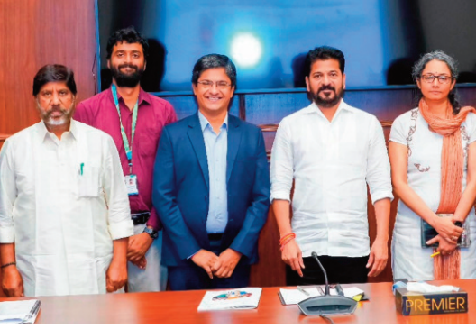
కార్యారంభ సోషల్ రెస్పాన్సిబిలిటీ ఫండ్స్ పరంగా