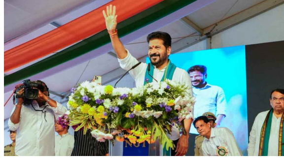
రాజకీయంగా తనకు భిన్నాభిప్రాయాలు ఉన్నాయి. కానీ వారి నియోజకవర్గాల్లో కూడా ప్రభుత్వం సంక్షేమం, అభివృద్ధి కార్యక్రమాల అమలు చేస్తూ మా నిజాయితీ నిరూపించుకున్నామన్నారు. నర్సెట్

ఎన్నికల వరకే రాజకీయాలని, ఎన్నికల తర్వాత అభివృద్ధిపైనే నా దృష్టి అని సీఎం చెప్పారు. కేసీఆర్, కేటీఆర్, హరికే రావుతో