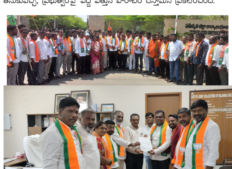
తీసుకువచ్చి, ప్రభుత్వంపై పెద్ద ఎత్తున పోరాటం చేస్తామని ప్రకటించింది.

రాజన్న సిరిసిల్ల జిల్లా మార్చి 20 ప్రజా దివాన్ రాష్ట్ర రాజకీయాల్లో మళ్లీ హామీల అమలు అంశం వేడుకుతోంది. కాంగ్రెస్ ప్రభుత్వం ఇచ్చిన హామీలపై భారతీయ జనతా పార్టీ తీవ్ర స్థాయిలో విమర్శలు గుప్పించింది. రెండున్నర సంవత్సరాలు గడిచినా కాంగ్రెస్ పార్టీ ప్రకటించిన ఆరు ప్రధాన హామీలు, అలాగే వందల సంఖ్యలో ఇచ్చిన వాగ్దానాలు ఇప్పటికీ అమలు కాలేదని బీజేపీ నేతలు ఆరోపిస్తున్నారు. విద్యార్థులకు ఇవ్వాల్సిన విద్యార్థి భృతి, నిరుద్యోగులకు హామీ ఇచ్చిన నిరుద్యోగ భృతి ఇంకా అందలేదని, జాబ్ క్యాలెండర్ విడుదల విషయంలో కూడా ప్రభుత్వం విఫలమైందని మండిపడ్డారు. ఇక రైతుల పరిస్థితి దారుణంగా ఉందని, రైతు భరోసా కూడా ఎన్నికల సమయంలో మాత్రమే గుర్తుకు వస్తోందని విమర్శించారు. మహిళలకు ప్రకటించిన కల్యాణ లక్ష్మి, తులం బంగారం వంటి పథకాల అమలు ఎక్కడుండో చెప్పాలని ప్రశ్నించారు. ఈ నేపథ్యంలో రాష్ట్రవ్యాప్తంగా అన్ని జిల్లాల కలెక్టరేట్ రిప్రజెంటేటివ్ ఇవ్వాలని నిర్ణయించినట్లు బీజేపీ స్పష్టం చేసింది. ప్రభుత్వం హామీలు నెరవేర్చే వరకు ఉద్యమాన్ని మరింత ఉధృతం చేస్తామని హెచ్చరించింది. ప్రజల్లో చైతన్యం