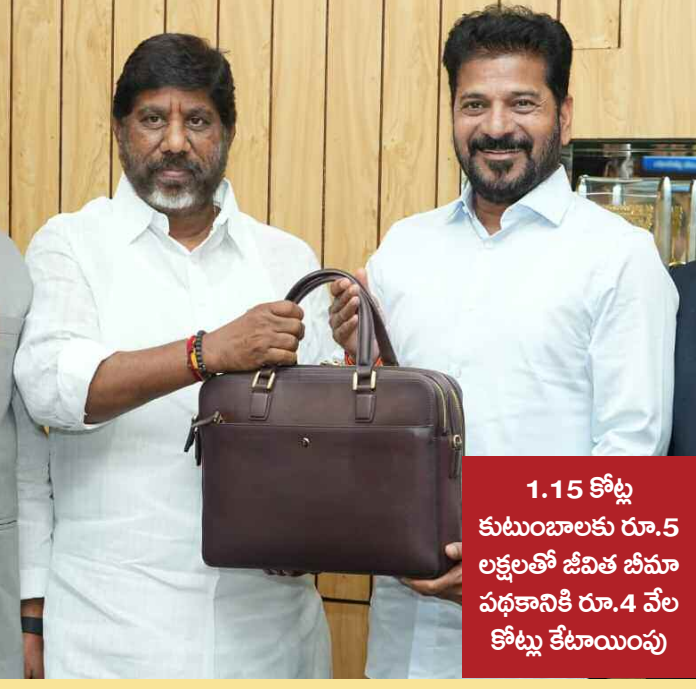
1.15 కోట్ల కుటుంబాలకు రూ.5 లక్షలతో జీవిత బీమా పథకానికి రూ.4 వేల కోట్లు కేటాయింపు

దేశంలో తెలంగాణను నంబర్ వన్ గా నిలబెట్టడం లక్ష్యం