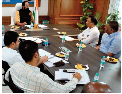
ఆయన హామీ చేశారు. మొత్తానికి, సామాన్య వర్గాల్లో మంట ఆరిపోకుండా ప్రభుత్వం అన్ని జాగ్రత్తలు తీసుకుంటోందని ఆయన భరోసా ఇచ్చారు.

చేయవద్దని ఆయన విజ్ఞప్తి చేశారు. హోటళ్లు, ఇతర వ్యాపార సంస్థలు వాడే 19 కేజీల కమర్షియల్ సిలిండర్ల సరఫరాలో మాత్రం తగ్గదల ఉన్న మాట వాస్తవమేనని మంత్రి అంగీకరించారు. కేంద్ర ప్రభుత్వం నిర్దేశించిన కొత్త మార్గదర్శకాల వల్ల గతంలో ఉన్న సరఫరాలో కేవలం 20 శాతం మాత్రమే ప్రస్తుతం అందుబాటులో ఉందని ఆయన వివరించారు. గతంలో రోజుకు 23,000 కమర్షియల్ సిలిండర్లు సరఫరా అయ్యే చోట, ఇప్పుడు కేవలం 6,200 మాత్రమే వస్తున్నాయని, ఈ సమస్యను పరిష్కరించేందుకు కేంద్ర ప్రభుత్వంతో చర్చలు జరుపుతామని ఆయన హామీ ఇచ్చారు. రాష్ట్రంలో గ్యాస్ పంపిణీ సక్రమంగా జరిగేలా చూడటంతో పాటు, అక్రమ నిల్వలను అరికట్టేందుకు రాష్ట్ర, జిల్లా స్టాంపు కమిటీలను ఏర్పాటు చేసినట్లు మంత్రి తెలిపారు. గృహ అవసరాల సిలిండర్లు పక్కదారి పట్టకుండా కఠిన చర్యలు తీసుకుంటామని