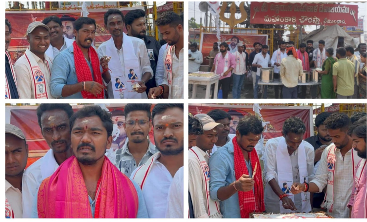
వేములవాడ/ ప్రజా దివాన్ మార్చి 14

జనసేన పార్టీ 12వ ఆవిర్భావ దినోత్సవాన్ని పురస్కరించుకొని వేములవాడలో ఘనంగా వేడుకలు నిర్వహించారు. ఈ కార్యక్రమంలో రాజన్న సిరిసిల్ల