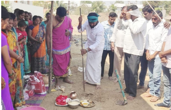
వేములవాడ మండలం/ప్రజాదివాన్ మార్చి 13 వేములవాడ అర్బన్ మండలం సంకెపల్లి గ్రామంలో మహిళా సంఘాల కోసం నిర్మించనున్న