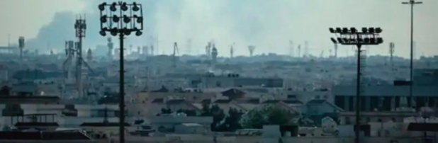
ఇజ్రాయీల్ దాడులకు దీటుగా ఇరాన్ బాంబులు

● టెప్రోన్ ప్రార్థనా మందిరంలో ఖమేసీ భౌతిక కాయం ● మూడ్రోజుల పాటు ప్రజల సందర్శనకు అనుమతి ఇరాన్, అమెరికా-ఇజ్రాయేల్ సంయుక్త కూటమి మధ్య యుద్ధం ఐదోరోజున బుధవారం మరింత తీవ్రమైంది. దీంతో మధ్యప్రాచ్యంలో ఉద్రిక్తతలు అంతకంతకూ పెరుగుతున్నాయి. ఇరాన్ క్షిపణి లాంచర్లు, ఆయుధ ఫ్యాక్టరీలను టార్గెట్ చేస్తూ ఇజ్రాయేల్ దాడులు జరుపుతోంది. ఇరాన్లోని ఉర్మియా, కెర్మాన్షా నగరాలకు కూడా దాడులను విస్తరించింది. తూర్పు టెప్రోన్లో భారీ పేలుడు శబ్దాలు వినిపిస్తున్నాయి. ఇదే సమయంలో ఇజ్రాయేల్తో సహా గల్ఫ్ దేశాల్లోని అమెరికా సైనిక స్థావరాలపై డజన్ల కొద్దీ బాలిస్టిక్ క్షిపణులు, డ్రోన్లతో ఇరాక్ దాడులు కొనసాగిస్తోంది.