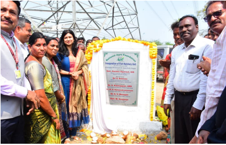
బోయినపల్లి, ఫిబ్రవరి -- 27 ప్రజా దివాన్

మత్స్య కార్మికులకు ఉపాధి కల్పించేందుకు ప్రభుత్వం పథకాలు అమలు చేస్తున్నదని కలెక్టర్ గరిమ అగ్రవాలే తెలిపారు. నేషనల్ అగ్రో ఫౌండేషన్ ఆధ్వర్యంలో బోయినపల్లి మండలం నర్సింగాపూర్ గ్రామంలో రూ. 8 లక్షల 91 వేలతో మంచినీటి చేప పిల్లల ఉత్పత్తి కేంద్రాన్ని ఏర్పాటు చేయగా, శుక్రవారం కార్యక్రమానికి ముఖ్య అతిథిగా కలెక్టర్ గరిమ అగ్రవాలే హాజరై, అడిషనల్