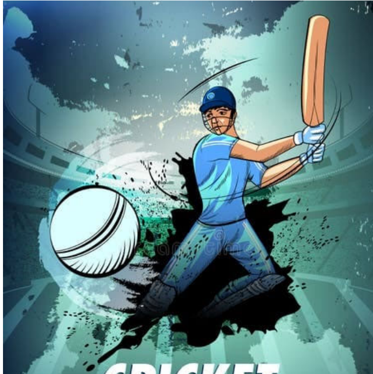
ఖమ్మం ప్రతినీధి ఫిబ్రవరి 26 ప్రజా దివాన్ పాలేరు నియోజకవర్గ క్రికెట్

ప్రేమికులకు పండుగలాంటి వార్త! ఏదులాపురం మున్సిపాలిటీ పరిధిలోని కరుణగిరి యూత్ ఆధ్వర్యంలో నియోజకవర్గ స్టామి క్రికెట్ టోర్నమెంట్ నిర్వహించేందుకు సర్వం సిద్ధమైంది. మార్చి 1వ తేదీ నుంచి ఏదులాపురం కరుణగిరిలోని కేంద్రీయ విద్యాలయం రోడ్డు మైదానంలో ఈ పోటీలు ప్రారంభం కానున్నాయి. గ్రామీణ ప్రాంతాల్లోని అద్భుతమైన ప్రతిభ కలిగిన క్రీడాకారులను వెలికితీసేందుకే ఈ మెగా టోర్నీని నిర్వహిస్తున్నట్లు నిర్వాహకులు తెలిపారు.