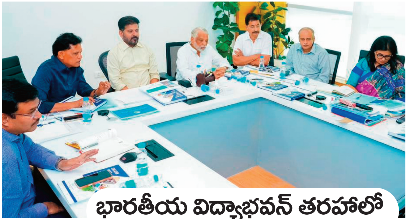
భారతీయ విద్యాభవన్ తరహాలో