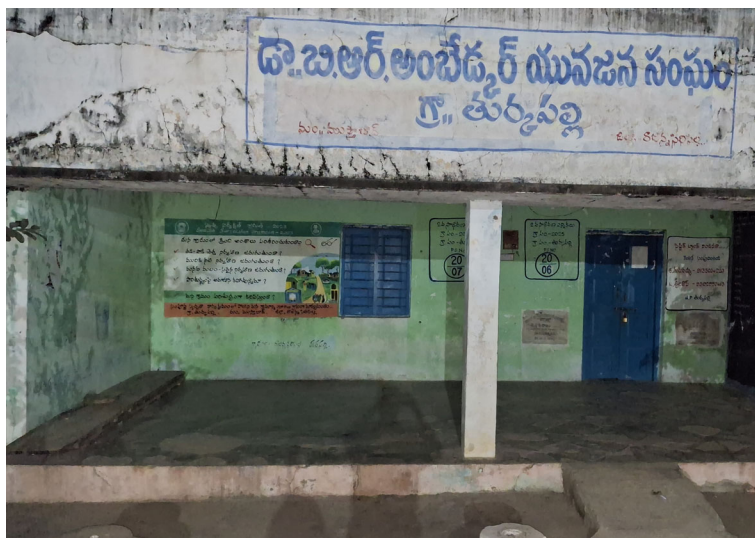
పంపిణీ చేస్తున్నారని అన్నారు. గ్రామస్థులకు 9 తేదీ వరకే పంపిణీ చెయ్యడం జరిగింది. కొందరు గ్రామస్థులు కిలోమీటర్ దూరం నుండి రేషన్ బియ్యం తీసుకోవాల్సిన పరిస్థితి వచ్చిందంటూ తప్పుడు ఫోటోలు సృష్టించి ప్రముఖ