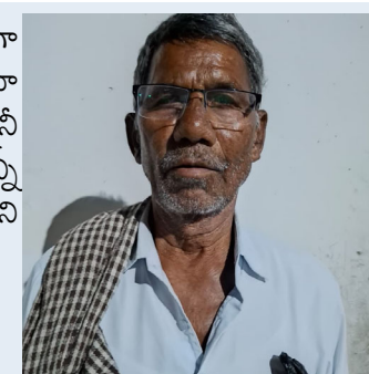
జిల్లా మల్లయ్య, తుర్కపల్లి, ముస్సాబాద్

తుర్కపల్లి లో గత కొన్ని సంవత్సరాలుగా తుర్క పల్లి గ్రామంలోని అంబేద్కర్ భవనాల్లోనే బియ్యం సరఫరా చెయ్యడం హర్షణీయమ న్నారు. దూరాన్ని తగ్గించి బియ్యాన్ని అందించడం గొప్ప విషయమని తెలిపారు.