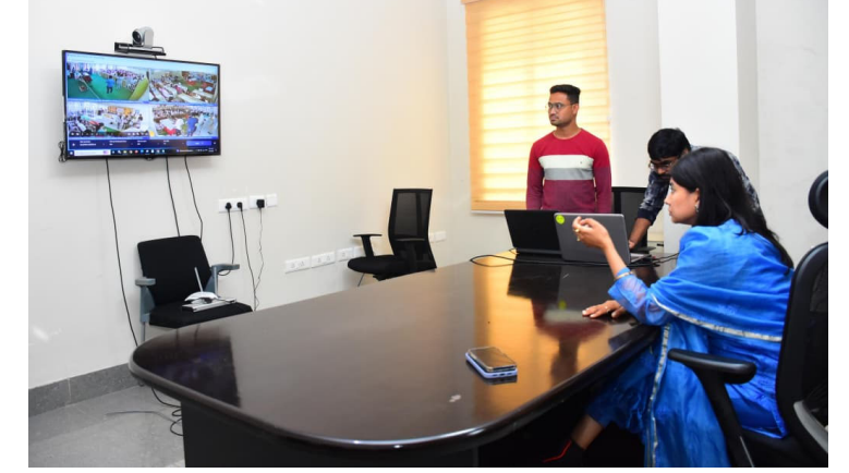
రాజన్న సిరిసిల్ల, ఫిబ్రవరి - 16 ప్రజా దివాన్