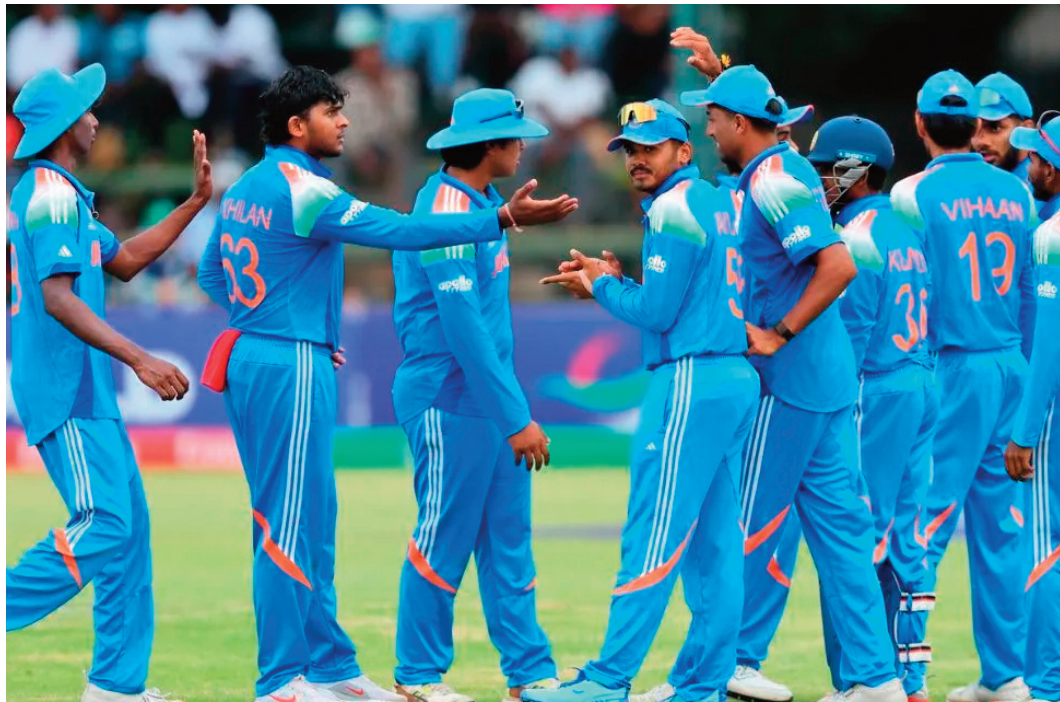
అలాన్ని స్పష్టంగా చూపిస్తోంది.

అండర్-19 వరల్డ్ కప్ లో భారత్ విజయం శాతం 92.1 శాతంగా ఉంది. వరల్డ్ కప్ చరిత్రలో ఇది గొప్ప రికార్డుల్లో ఒకటి. మొత్తంగా చూస్తే.. 2016 నుంచి అండర్-19 వరల్డ్ కప్ లో భారత్ యువ జట్టు ఆధిపత్యం