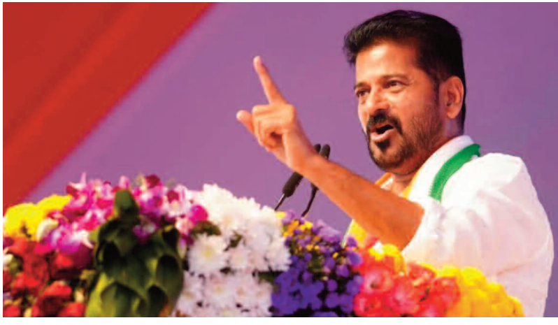
పాపాల బైరవుడి (కేసీఆర్) చరిత్రను...